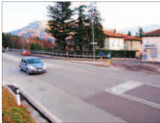
L'incrocio sarà reso pedonale con un semaforo

Dopo l'apertura delle gallerie il traffico dall'abitato di Martignano, Cognola e di tutta la zona est della città ha avuto un drastico alleggerimento e per questo è stato deciso di rifare l'incrocio in modo da permettere, oltre al passaggio pedonale su via Bassano, l'attraversamento veicolare da via alle Coste a via Muralta e la svolta veicolare a sinistra da via alle Coste a via Bassano. L'intervento prevede la realizzazione di un'isola spartitraffico sopraelevata rispetto alla sede stradale della lunghezza di circa 80 metri con cordone e